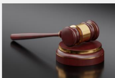
Modiwl 2: Rheolau ar gyfer gwybodaeth am alergenau