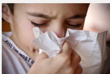
Modiwl 1: Effeithiau alergeddau yn y corff