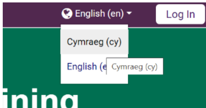
Ffigur 1. Ciplun o'r botymau dewis iaith

Mae'r hyfforddiant ar gael yn Gymraeg ac yn Saesneg. I newid yr iaith i'r Gymraeg, symudwch y cyrchwr dros y gair 'Saesneg (en)', yng nghornel dde uchaf y dudalen, a dewiswch 'Cymraeg (cy)'.