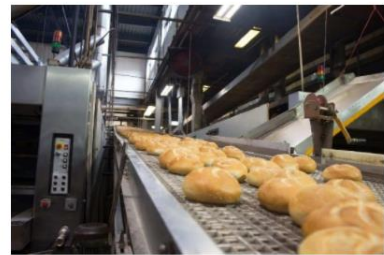
Modiwl 3: Rheoli alergenau yn y ffatri