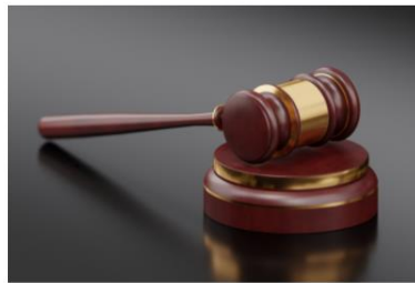
Modiwl 2: Rheolau ar gyfer gwybodaeth am alergenau