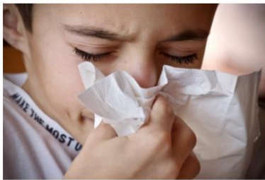
Modiwl 1: Effeithiau alergeddau yn y corff